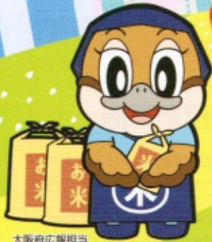
大阪府広報担当 副知事もずやん